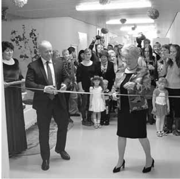
Открытие дополнительной группы на базе муниципального детского сада № 55 с. п. Алакуртти

● на базе детских садов 62, 63 созданы Службы ранней помощи детям с ограниченными возможностями здоровья. Их особенность – комплексное взаимодействие специалистов образования, здравоохранения и соци-