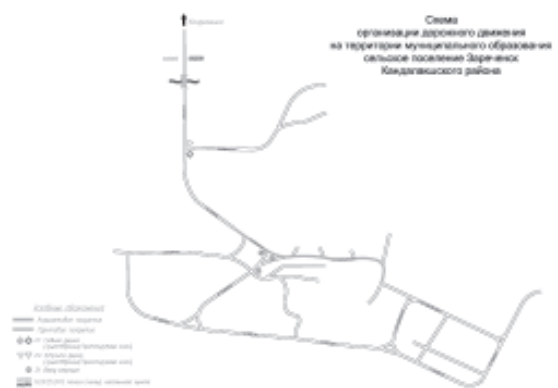
Рис. 1.4.1. Схема организации дорожного движения на территории муниципального образования сельское поселение Зареченск Кандалякшского района.

На рисунках 2,3 отображены схемы организации дорожного движения н.п. Зареченск и с. Ковдозеро в соответствии с ранее разработанным проектом организации дорожного движения на территории муниципального образования сельское поселение Зареченск Кандалякшского района, выполненный ООО «Градпроект», г. Омск в 2017 г. На данных схемах также отображены участки улично-дорожной сети асфальтовым и грунтовым покрытием.