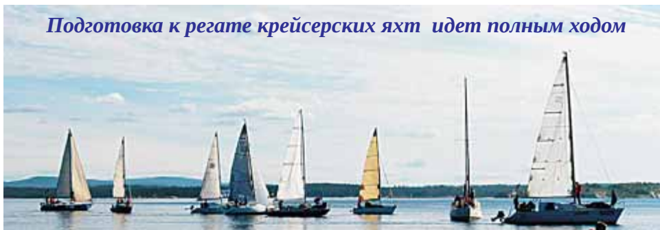
Подготовка к регате крейсерских яхт идет полным ходом

Местом проведения торжеств станет Монастырский наволок. 2 июля здесь откроется фестиваль исторической реконструкции. На побережье Белого моря на два дня развернется лагерь викингов с показательными сражениями, турнирами и воинскими состязаниями. Будут работать интерактивные пло-