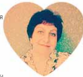
Редакция газеты «НИВА»

Желаем крепкого здоровья, Поддержки близких и друзей, Оптимистичного настроения И, словно праздник, ярких дней!