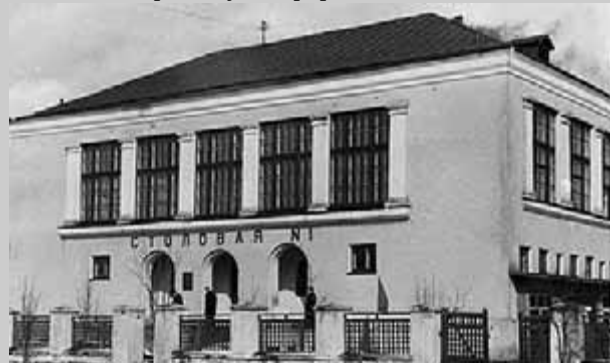
(По публикациям в газете «Кандалакшский коммунист» за 1957 год)

Большую работу провёл в 1957 году коллектив Кандалакшского заповедника. На 281 гектар увеличена его площадь, к его территории присоединена группа островов в южной части Кандалакшского залива. В этом районе весной и осенью в массе держится гага. Успешно выполнен в 1957 г. план кольцевания. Окольцовано свыше 11 000 птиц. К 40-й годовщине Советской власти в конторе заповедника открыт музей природы.