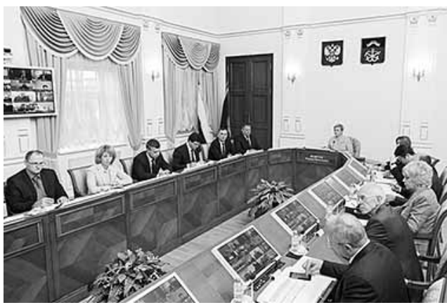
На заседании Правительства Мурманской области обсуждаются вопросы оздоровления северян

Долгая полярная ночь, сложный климат, нехватка витаминов – все это особенности жизни в Заполярье. Те люди, которые живут здесь и работают на развитие Арктики, не смогут сохранить крепкое здоровье без серьезной государственной поддержки. Об этом говорила губернатор Мурманской области Марина Ковтун на оперативном совещании, одной из тем которого стал ход оздоровительной кампании текущего года.