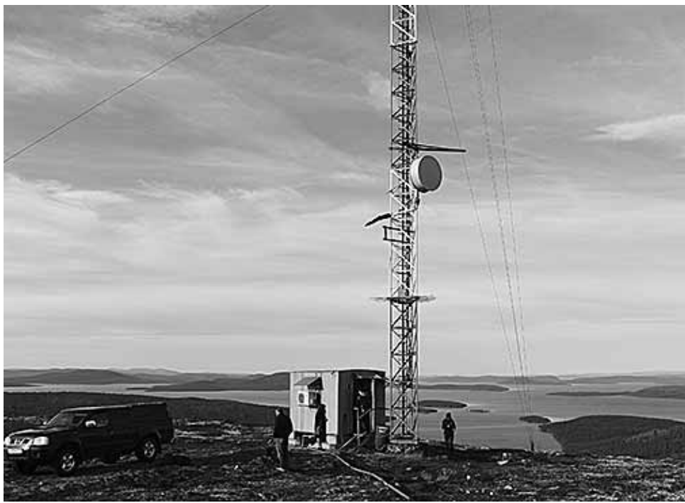
На правах рекламы.

Качество мобильной связи и скоростной 3G-интернет обеспечивает, как выяснилось, компактное и энергоёмкое оборудование, которое после модернизации сможет предоставлять услуги связи и в стандарте 4G. Станция полностью автоматизирована: за доли секунды соединяет позвонившего с нужным абонентом, при возникновении не-