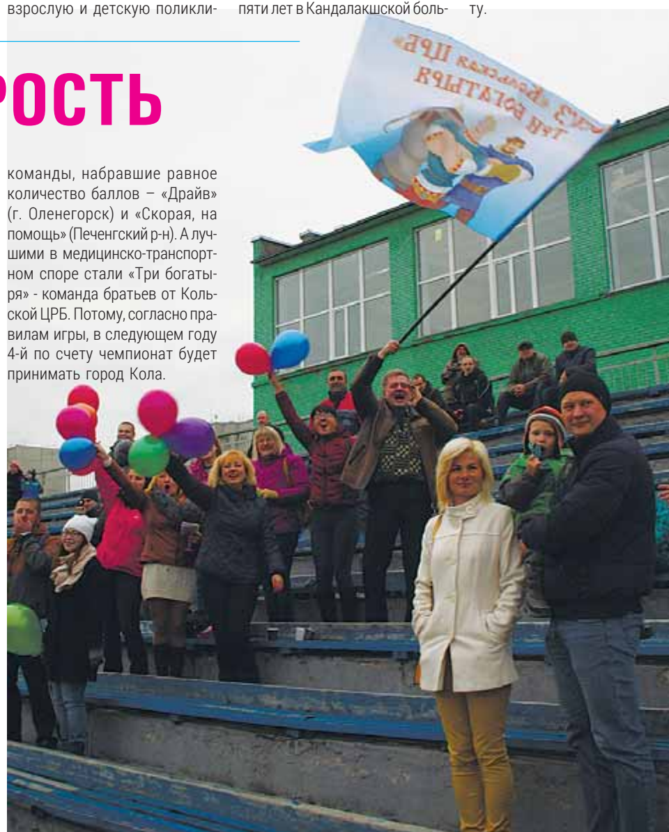
Страницу подготовила Светлана МАЙБОРОДА